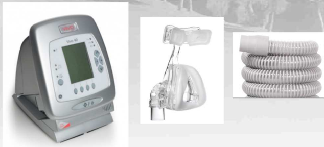
Máquina, mascarilla y tubuladura

Existen varias modalidades respiratorias programables en su máquina. En función de su patología el médico programará su terapia. Para ello necesitará el siguiente material proporcionado por la Unidad del Sueño